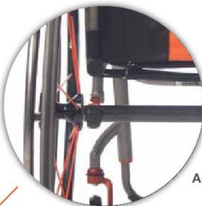
Achse - fest verschweißt