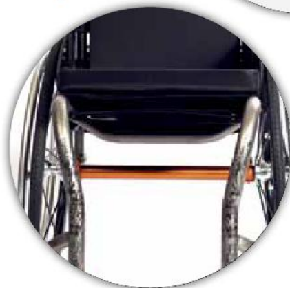
Rahmenverjüngung in zwei Maßen wählbar